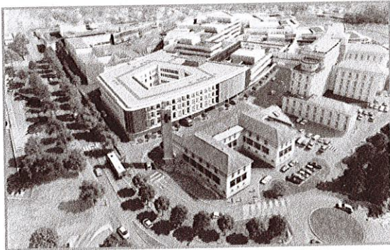
Le projet de nouveau bâtiment (document Michel Beauvais)

Après une année de travaux préparatoires, mise à profit pour formaliser le programme de ses besoins et établir un cahier des charges, le centre hospitalier de Périgueux vient donc de désigner l'architecte qui sera chargé de mener à bien la seconde tranche de restructuration de l'établissement (lire l'Echo d'hier). Un choix qui ne sera véritablement acté que fin janvier après la signature du marché et qui a été délicat puisque l'équipe chargée d'étudier les offres travaillait sur des projets anonymes comme