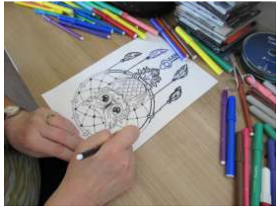
Hêtres « Des coloriages mis à disposition des résidents »

Bonne réception à tous. L'équipe d'animation des Félibres.