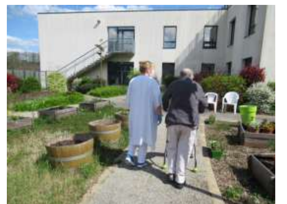
Peupliers « Balade au jardin »