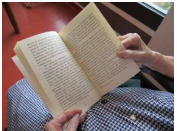
Merisiers « Lecture »