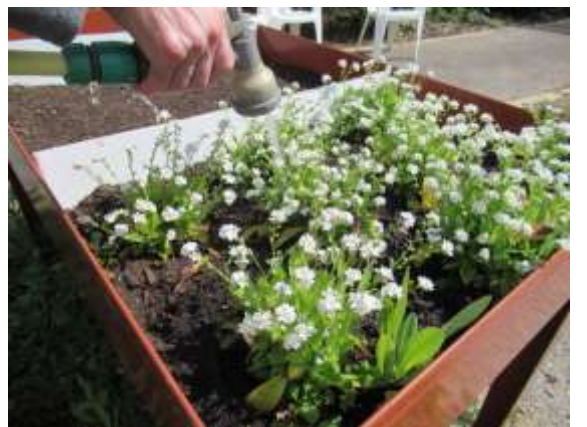
Noyers « Entretien des fleurs »