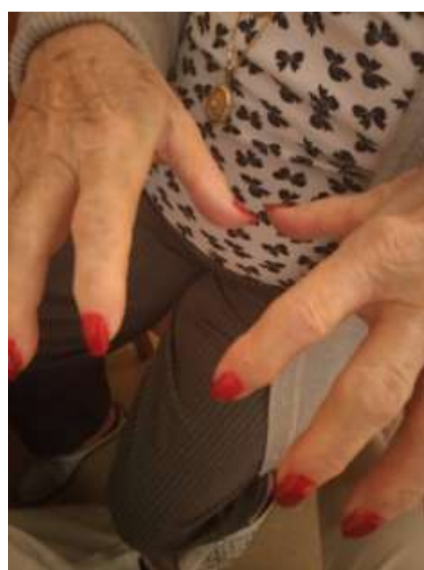
Séance de manucure

Bonne réception à tous. L'équipe d'animation de Parrot.