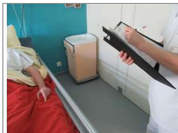
Passage dans les chambres