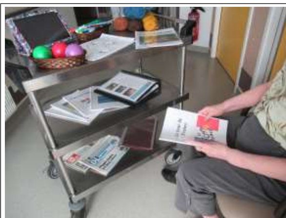
Chariot mobile d'activités