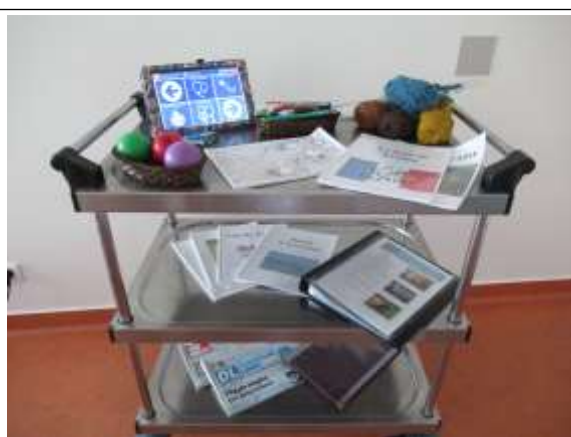
A chacun son activité