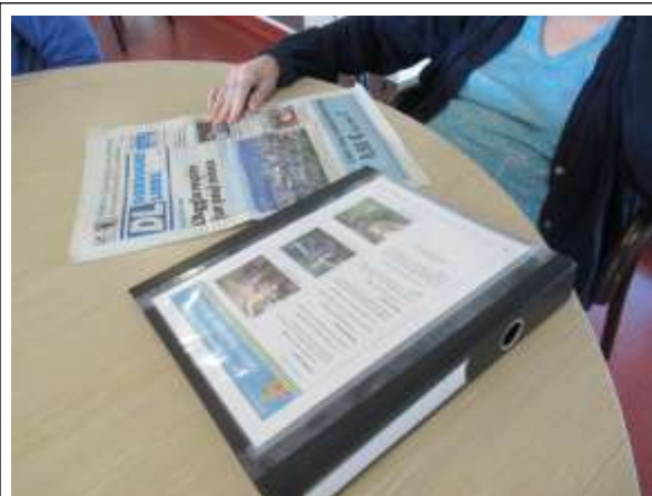
Lecture du journal