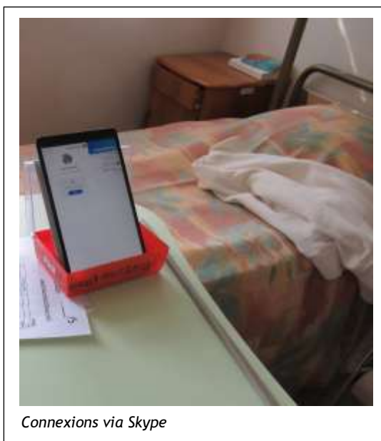
Connexions via Skype

Bonne réception à tous. L'équipe d'animation de Douglas.