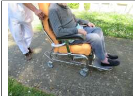
Balade dans le parc