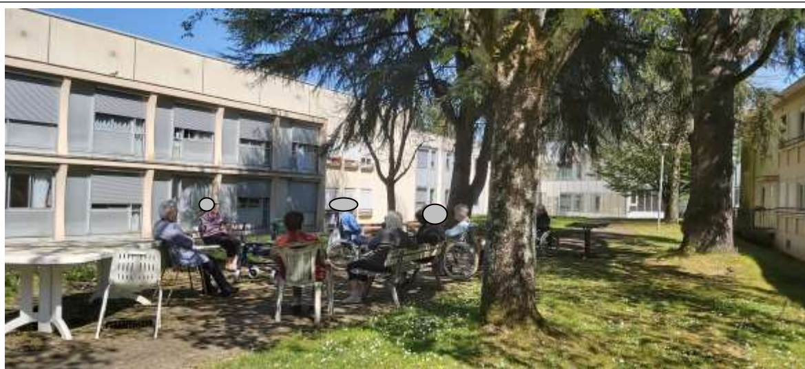
Balade dans le parc en respectant les distances