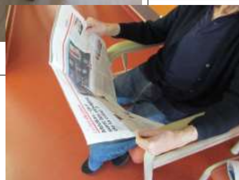
Lecture du journal