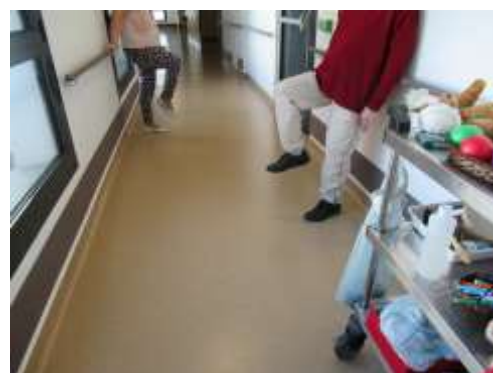
Exercices de souplesse