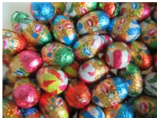
Œufs de Pâques

Bonne réception à tous. L'équipe d'animation des Félibres.