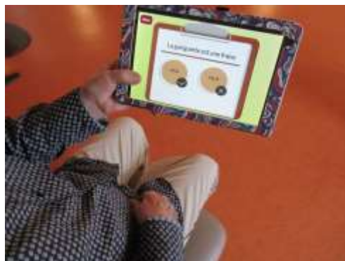
Jeu sur tablette