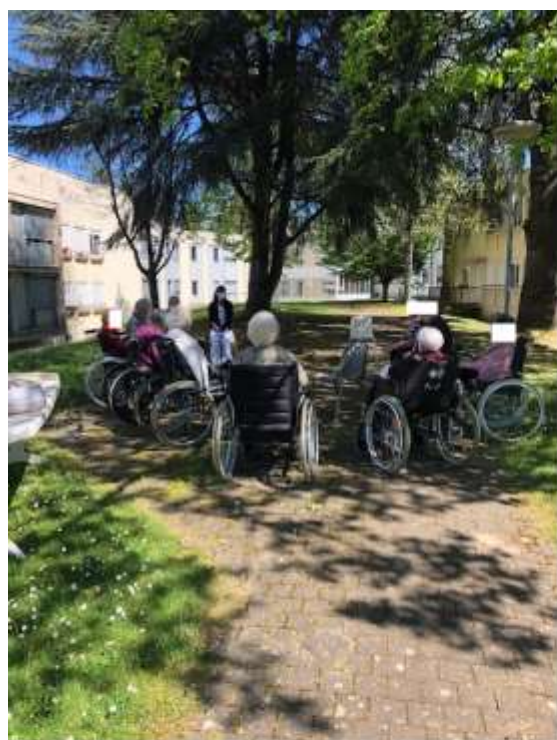
Moment de partage sous les arbres

Bonne réception à tous. L'équipe d'animation de Parrot.