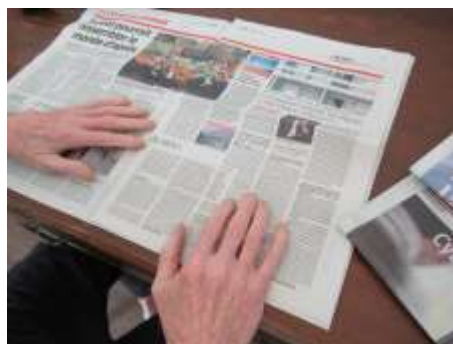
Lecture du journal