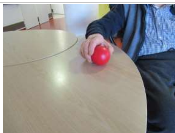
Noyers « Jeu de balle sur table »