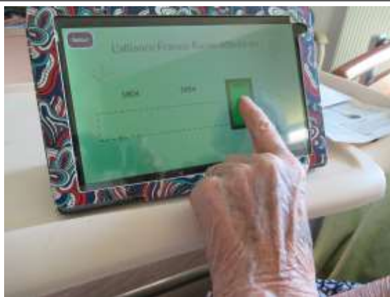
Hêtres « Des jeux sur la tablette »

Enfin, certains ont effectué des mouvements pour rester en forme et ont pris plaisir dans des jeux de balle.