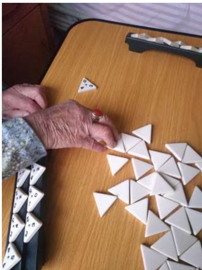
Jeu de société