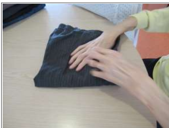
Merisiers « Pliage de linge »